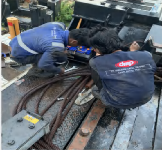
Dinas Lingkungan Hidup Service & Maintenance Crane Kato 1300RX.